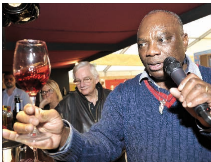
L'année passée, le sommelier virtuose avait subjugué son auditoire.