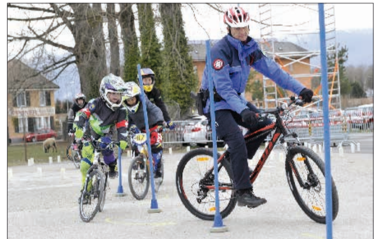
La prévention, l'un des maîtres-mots de la présence de la police régionale au Comptoir.