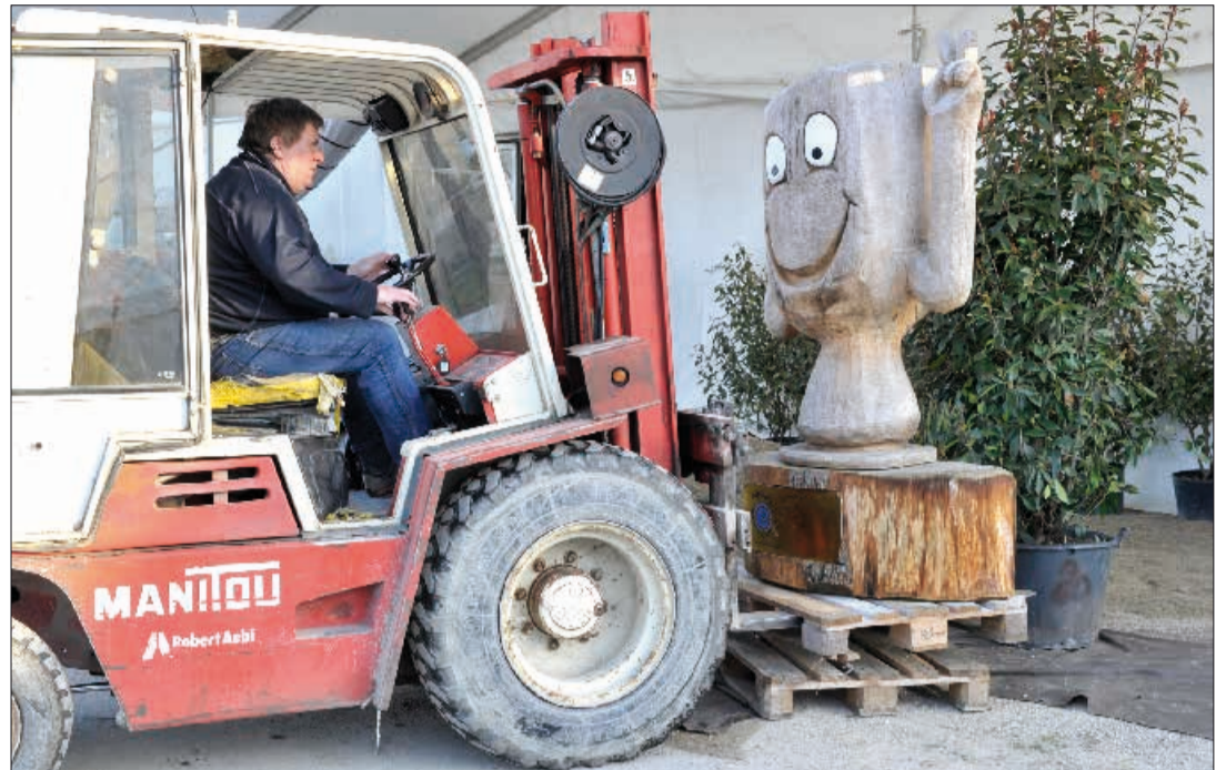
Chaque année, le trophée «Le Régionnaire» est placé devant l'entrée du Comptoir en attendant de rejoindre le village vainqueur.