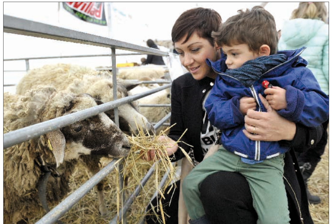
La ferme éphémère du Comptoir est un endroit privilégié pour découvrir, en famille, les animaux de nos campagnes.

Reste que les adultes trouveront également leur compte dans la Ferme des animaux. «Avec la collaboration de l'Agence d'information agricole romande (AGIR), nous voulons dialoguer et informer les consommateurs sur la fonction nourricière et productive de l'agriculture de