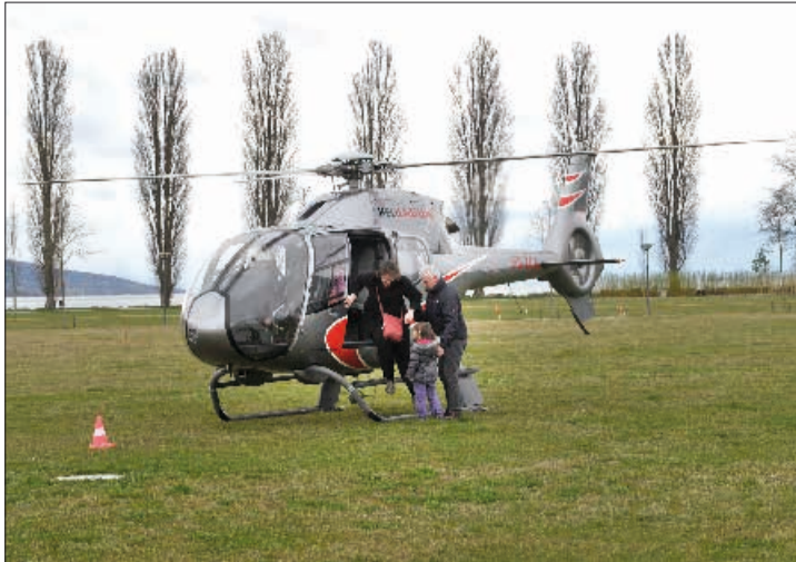
Une occasion pour découvrir la région de haut.