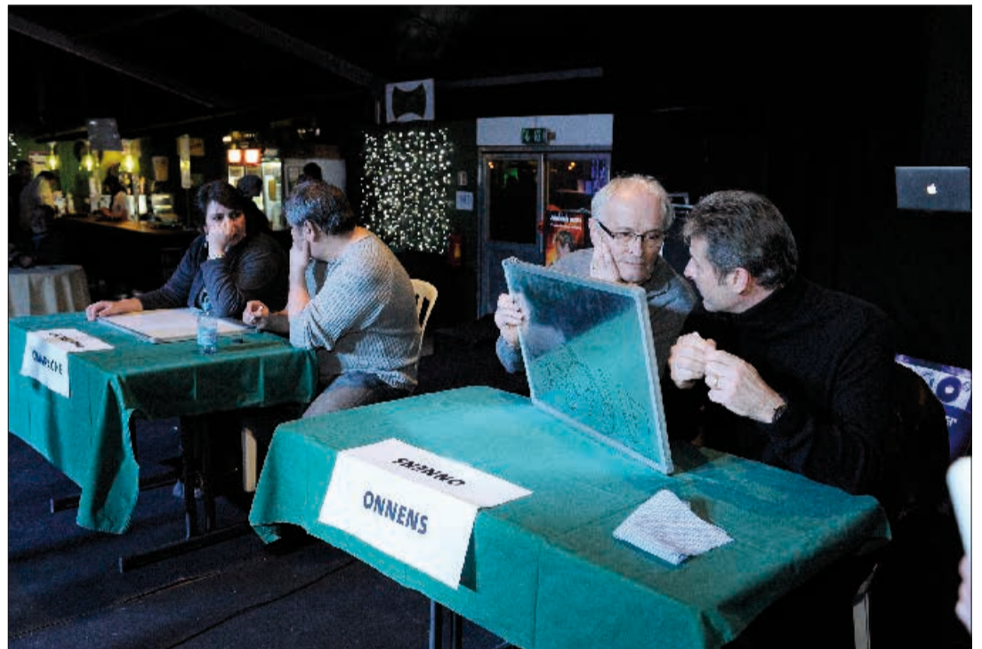
Lors de la dernière édition, le Trophée des Communes avaient vu s'affronter, au premier tour, les villages de Champagne et d'Onnens.