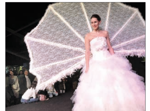
Un défilé de robes de mariée animera le podium le samedi 9 avril (21h). Duperrex-a

Le Podium des bars du Comptoir sera le lieu de différentes animations, tant en journée qu'en soirée, qui devraient ravir le public. On retrouvera les désormais incontournables défilés de mode, shows des écoles de danse ou de pole-dance... On retrouvera, encore, une démonstration de boxe ou un concert de la guggenmusik des Cradzets. Y.P. ■