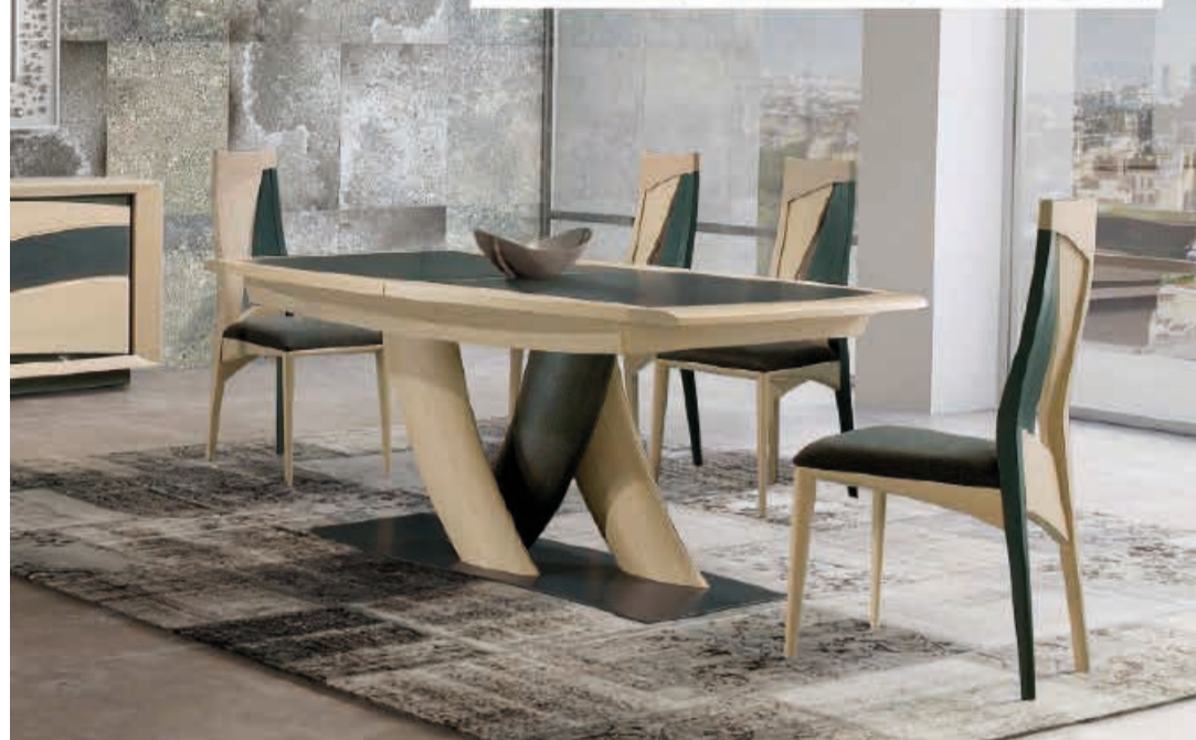
Table avec plateau céramic et rallonges