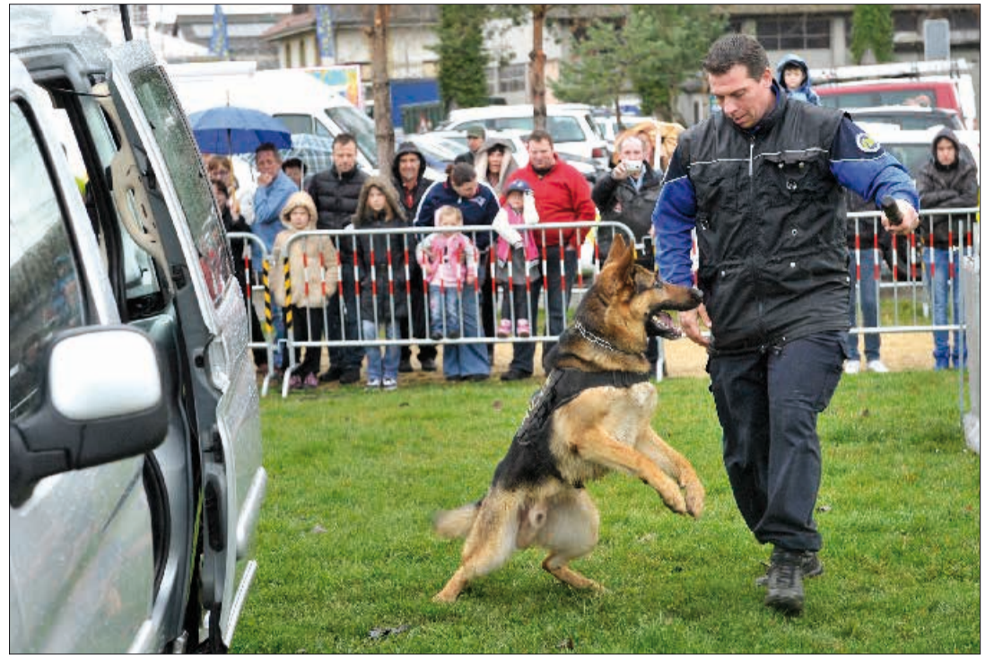
Les démonstrations de maîtres-chien sont toujours prisées par les visiteurs du Comptoir. Cette année, elles sont prévues le dernier dimanche du Comptoir, le 10 avril, de 14h à 15h30.

Un programme riche et varié, qui permettra aux visiteurs du Comptoir de découvrir l'ensemble des prestations de ce corps de police régional, fort d'une centaine d'hommes et de femmes. Et peut-être susciter quelques vocations, le recrutement des aspirants étant ouvert jusqu'au 10 mai prochain.