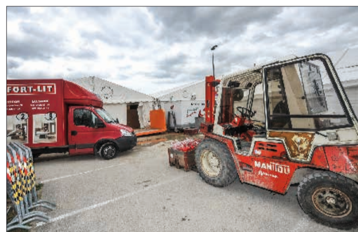
C'était le bal des véhicules, mardi après-midi, aux Rives du Lac. à Yverdon-les-Bains, devant les tentes du Comptoir.