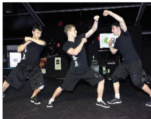
Le Team Stama s'était déjà produit l'année passée au Comptoir. Duperrex-a